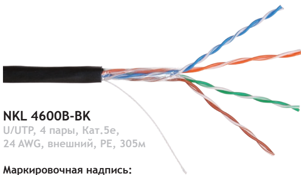
NKL 4600B-BK U/UTP, 4 пары, Кат.5е, 24 AWG, внешний, PE, 305м

Кабели 4-й серии обладают отличными характеристиками при разумной цене, что делает их оптимальным выбором для построения сетей в проектах, не требующих системной поддержки. Данная модель поставляется в картонных коробках.